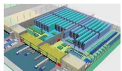
Raum für Logistik